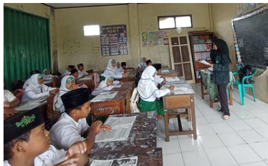
Gambar 1. Tahap Penyajian Kelas

Tahap kedua adalah pembentukan tim ( teams ). Pada tahap ini peserta didik dibagi ke dalam beberapa kelompok kecil yang terdiri dari 4-5 orang yang bersifat heterogen berdasarkan kemampuan akademik, jenis kelamin, dan karakteristik peserta didik. Setiap kelompok mempelajari dan mendiskusikan materi yaitu terkait ibadah haji dan umrah serta mengerjakan latihan soal yang diberikan oleh peneliti. Kegiatan diskusi kelompok memungkinkan peserta didik untuk saling bertukar pendapat, membantu teman yang mengalami kesulitan, dan memperdalam pemahaman terhadap materi serta mempersiapkan diri untuk mengikuti permainan dan turnamen. Setiap anggota memiliki tanggung jawab untuk memahami materi karena keberhasilan tim bergantung pada kontribusi individu. Interaksi yang terjadi dalam kelompok juga dapat meningkatkan keterampilan sosial dan kemampuan komunikasi peserta didik (Fitriani et al., 2025).