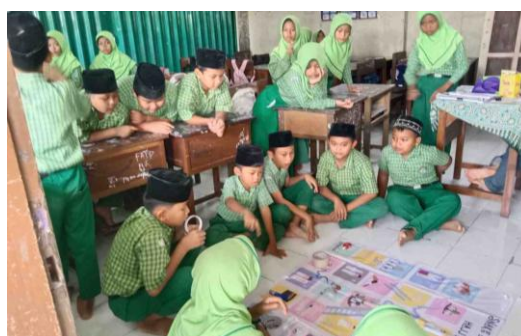
Gambar 2. Permainan Snake and Ladder Game

Tahap ketiga adalah permainan ( games ) yang berisi pertanyaan-pertanyaan yang berkaitan dengan materi haji dan umrah. Pada tahap ini peserta didik melaksanakan permainan menggunakan media snake and ladder game yang telah dimodifikasi dengan menambahkan kartu soal pada beberapa kotak permainan. Pertanyaan dirancang untuk menguji pemahaman peserta didik terhadap materi yang telah dipelajari pada tahap penyajian kelas dan diskusi kelompok. Permainan diikuti oleh perwakilan dari masing-masing kelompok yang berasal dari tim yang berbeda. Tujuannya agar setiap anggota kelompok benar-benar memahami materi, bukan hanya mengandalkan satu anggota saja (Ulya & Widodo, 2025).