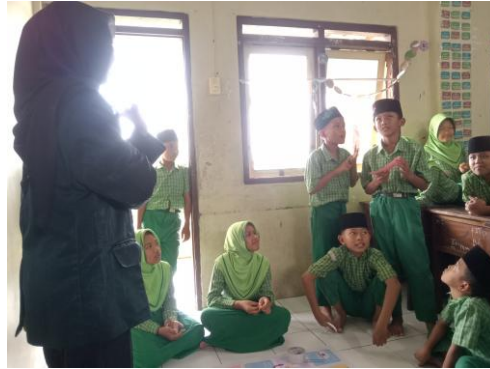
Gambar 3. Turnamen

terhadap materi, tetapi juga memperkuat konsep melalui aktivitas belajar yang bersifat interaktif dan menyenangkan (Handayani et al., 2024).