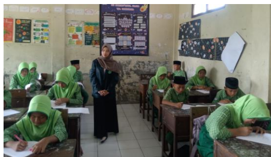
Gambar 5. Uji Coba Instrumen di Luar Sampel Penelitian yaitu di Kelas VI

Uji validitas menggunakan korelasi product moment dengan bantuan program jamovi versi 2.6.44. Adapun hasil uji validitas terhadap 20 butir soal yang diuji cobakan dapat dilihat pada tabel berikut: