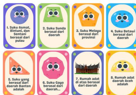
Gambar 2. Kartu soal

Selain pembuatan papan ular tangga, peneliti juga melakukan validasi terhadap media pembelajaran oleh ahli yaitu guru pamong SDN Bareng 1 sebagai validator. Kemudian, peneliti akan melakukan revisi sesuai dengan penilaian dan masukan dari validator. Tabel 3 menunjukkan hasil validasi media pembelajaran.