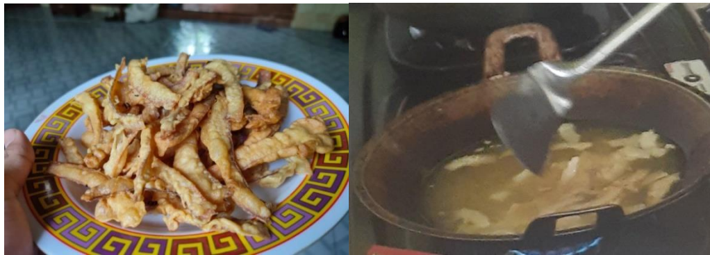
Gambar 4. Proses Pengorengan Keripik Kelapa

4) Tahap pengemasan dan pemberian variasi bumbu.