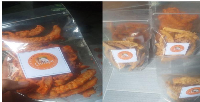
Gambar 6. Packing Keripik Kelapa

Peningkatan penjualan dibutuhkan pengemasan yang bagus, agar terlihat menarik dengan cara memberikan tambahan nama dalam kemasan keripik kelapa, pemberian stiker dalam kemasan agar terlihat mewah, kemasan juga sangat berpengaruh positif dan signifikan terhadap keputusan pembelian (Cries Setya Yanuar, Yekti Intyas, 2021). Untuk itu, tujuan utama dari pemberian kemasan pada produk adalah guna melindungi dan juga mencegah adanya kerusakan atas produk yang dijual. Selain itu, kemasan juga berguna sebagai sarana informasi dan juga pemasaran yang baik dengan membuat suatu desain kemasan yang kreatif, sehingga akan terlihat lebih menarik dan mudah diingat konsumen atau pelanggan. Keripik yang menyehatkan dan murah meriah.