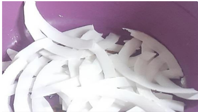
Gambar 2. Kelapa Muda yang Sudah Diserut