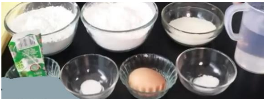
Gambar 3. Bahan Pembuatan Keripik Kelapa