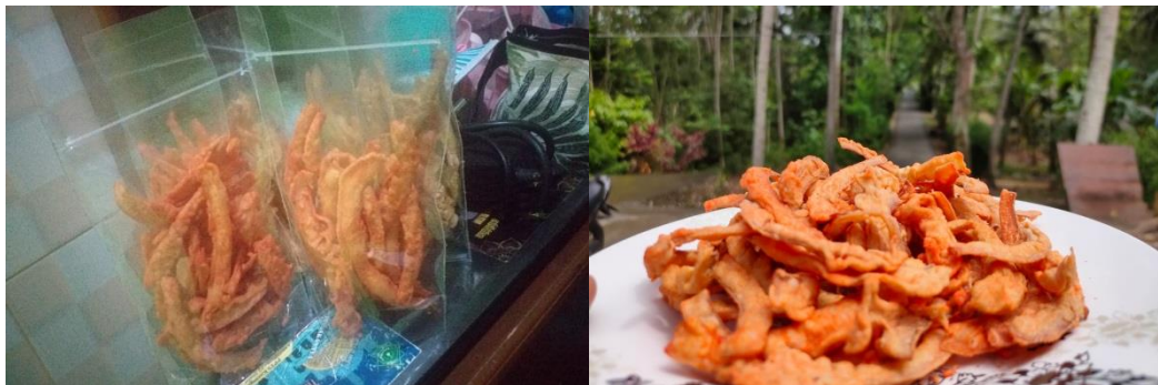
Gambar 5. Pemberian Variasi Bumbu & Pengemasan

4) Tahap pengemasan dan pemberian variasi bumbu.