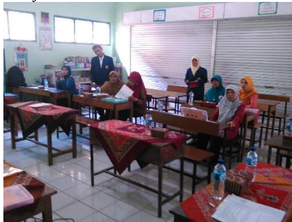
Gambar 5. Pendampingan Penggunaan Alat Peraga Matematika