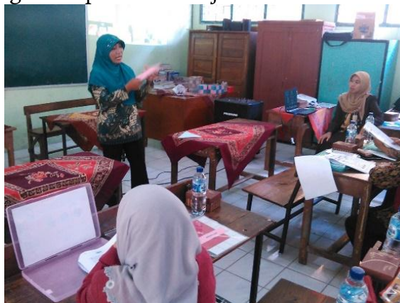
Gambar 6. Simulasi Pembelajaran Matematika Berbantuan Alat Peraga

Pada tahap simulasi, peserta pengabdian melakukan simulasi mengajar matematika SD berbantuan alat peraga di depan teman sejawat dan tim.