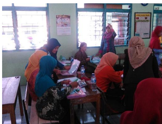
Gambar 3. Pendampingan Pembuatan Alat Peraga Matematika