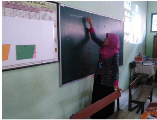
Gambar 4. Pemaparan dan Sosialisasi Penggunaan Alat Peraga Matematika