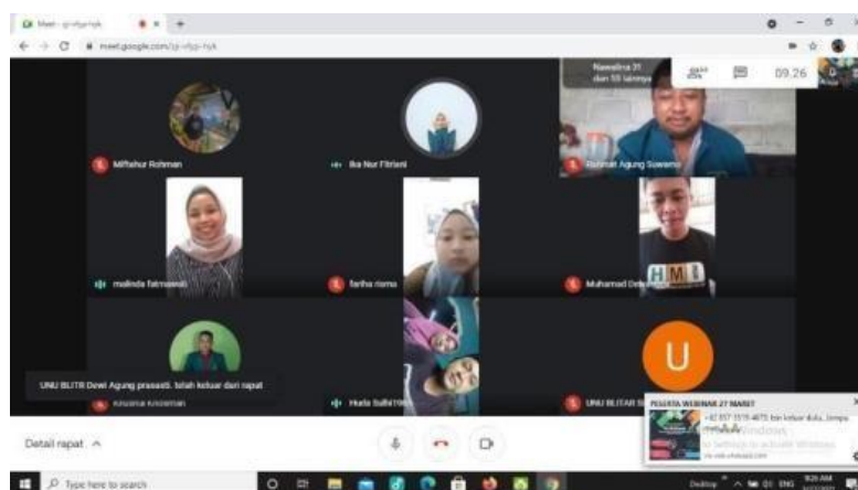
Gambar 3 Pelaksanaan Webinar

Setelah pemberian tugas dari pemateri, acara ditutup oleh moderator webinar. Berikut adalah hasil dokumentasi acara webinar.