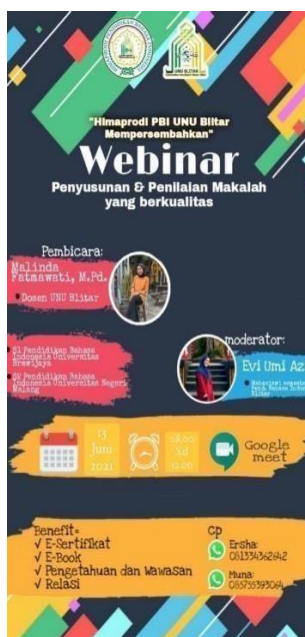
Gambar 1 Brosur Webinar

Persiapan dilakukan mulai 1 Mei 2021 melalui rapat antara ketua, anggota, dan mahasiswa PBI UNU Blitar yang menjadi panitia webinar. Hasil rapat tersebut berupa waktu pelaksanaan webinar, media webinar, dan pembagian tugas untuk panitia webinar. Berdasarkan rapat persiapan tersebut telah disepakati bahwa webinar dilakukan dengan media google meet yang pelaksanaannya juga telah disepakati pada 13 Juni 2021. Peserta webinar adalah mahasiswa Pendidikan Bahasa Indonesia, UNU Blitar, semua angkatan. Kegiatan tersebut dipromosikan dengan menyebarkan brosur pada media sosial program studi PBI. Berikut brosur kegiatan dapat dilihat pada Gambar 1.