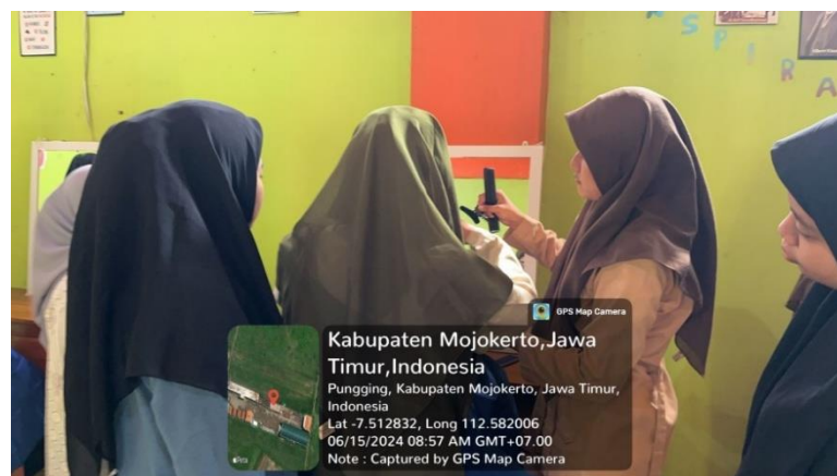
Gambar 3. Pelaksanaan Pemotongan Rambut Putri

Setelah pemberian materi tentang kewirausahaan dan pemotongan rambut, selanjutnya mempraktekkan pemotongan rambut dengan pendampingan ahli pemotongan rambut, guru dari SMK Tata Rias. Selain diajarkan bagaimana memotong rambut dengan baik dan benar, inspektur juga memberikan beberapa gaya model rambut yang sedang trend dan hits dikalangan anak zaman sekarang. Sehingga anak-anak dapat memotong sesuai dengan gaya yang diinginkan konsumennya nanti. Penelitian oleh (Nasila et al., 2023) menyatakan bahwa pelatihan yang disesuaikan dengan kebutuhan peserta dapat meningkatkan keterampilan dan kesiapan untuk berwirausaha, meskipun terdapat keterbatasan waktu. Selain itu, penelitian oleh (Haryanti & Dhofir, 2022) mengidentifikasi pentingnya pelatihan keterampilan di luar kurikulum formal untuk mengembangkan jiwa kewirausahaan, terutama di kalangan pelajar di pesantren