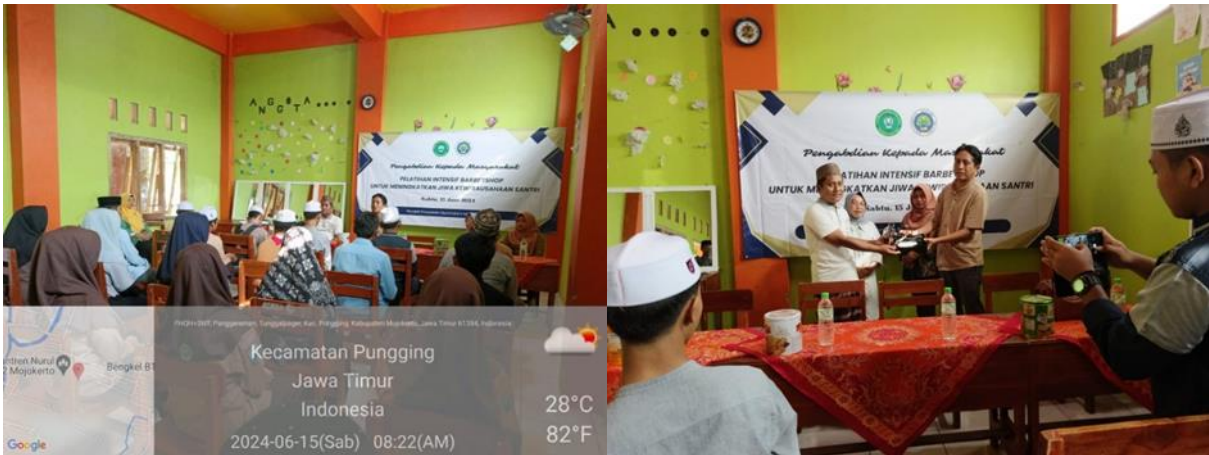
Gambar 2. Penyampaian Materi dan Penerimaan Sesorahan