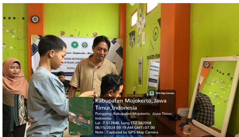
Gambar 4. Pelaksanaan Pemotongan Rambut Putra