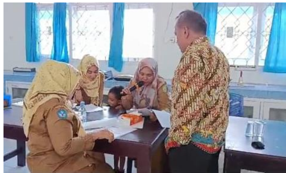
Gambar 3. Diskusi interaktif saat kegiatan pelatihan

Saat kegiatan sosialisasi tentang pentingnya kegiatan praktikum Fisika terlihat guru serta siswa SMA antusias menyimak materi yang disampaikan oleh pemateri bagaimana praktikum bisa meningkatkan motivasi dan pemahaman konsep Fisika siswa. Acara kemudian dilanjutkan dengan sesi tanya jawab. Dalam sesi tanya jawab ini mampu mempertemukan keinginan siswa agar belajar Fisika jangan hanya dilakukan di kelas dengan menghafal rumus serta mengerjakan latihan soal saja, melainkan Fisika yang abstrak bisa disajikan lebih konkret lagi dengan melakukan praktikum. Karena dengan belajar Fisika dengan hanya mengerjakan latihan soal saja membuat siswa semakin susah belajar, sehingga mengakibatkan siswa tidak senang dan tidak paham tentang Fisika. Kegiatan sosialisasi pengabdian pada Gambar 3.