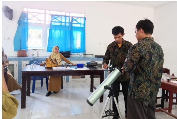
Gambar 7. Suasana penjelasan penggunaan teleskop

Saat sesi pelatihan berlangsung, ada guru Fisika dari SMA Negeri 4 Kota Ternate yang meminta bantuan kepada tim pengabdian untuk mempraktikkan cara penggunaan teleskop. Teleskop ini sudah lama dimiliki oleh sekolah, namun karena kendala guru Fisika tidak bisa menggunakannya maka teleskop ini belum pernah dipakai. Sehingga dalam kesempatan ini guru meminta bantuan dosen untuk menjelaskan dan mempraktikkan bagaimana cara menggunakan teleskop. Berikut Gambar 7 merupakan suasana saat dosen menjelaskan serta mempraktikkan penggunaan teleskop.