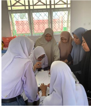
Gambar 8. Kegiatan saat pendampingan

Pelaksanaan kegiatan pengabdian ini secara garis sudah sesuai dengan target capaian. Ketercapaian jumlah peserta baik sebab hampir semua guru dan beberapa perwakilan siswa datang, tetapi karena keterbatasan ruang yang digunakan untuk kegiatan pengabdian terbatas maka hanya beberapa siswa saja yang diperkenankan masuk untuk mengikuti kegiatan. Ketercapaian sosialisai tentang pentingnya praktikum dalam pembelajaran Fisika sudah baik, hal ini terlihat dari antusias saat sesi tanya jawab dimana peserta guru sudah menyadari tentang pentingnya praktikum setelah ada siswa yang mengutarakan keinginan untuk sering dilakukan praktikum saat pembelajaran Fisika. Ketercapaian pengembangan alat peraga dan LKS Fisika sudah cukup baik diarenakan guru Fisika mampu membuat alat peraga dan mengembangkan LKS Fisika inuiri terbimbing. Meskipun hanya satu jenis yang dikembangkan semangat pembuatan alat peraga dan LKS Fisika ini akan dipantau terus oleh dosen karena kegiatan ini berada dalam salah satu agenda MGMP Fisika Kota Ternate. Setelah satu bulan selang kegiatan pengabdian, kami dari tim PkM melakukan kunjungan di sekolah SMA Negeri 4 Ternate dan saat itu dilakukan kegiatan praktikum dengan menggunakan alat peraga dan LKS Fisika inkuiri yang dikembangkan saat kegiatan PkM.