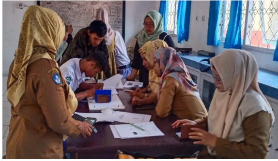
Gambar 6. Pengembangan alat peraga

Saat sesi pelatihan berlangsung, ada guru Fisika dari SMA Negeri 4 Kota Ternate yang meminta bantuan kepada tim pengabdian untuk mempraktikkan cara penggunaan teleskop. Teleskop ini sudah lama dimiliki oleh sekolah, namun karena kendala guru Fisika tidak bisa menggunakannya maka teleskop ini belum pernah dipakai. Sehingga dalam kesempatan ini guru meminta bantuan dosen untuk menjelaskan dan mempraktikkan bagaimana cara menggunakan teleskop. Berikut Gambar 7 merupakan suasana saat dosen menjelaskan serta mempraktikkan penggunaan teleskop.