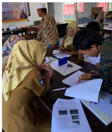
Gambar 4. Tahapan pengembangan LKS