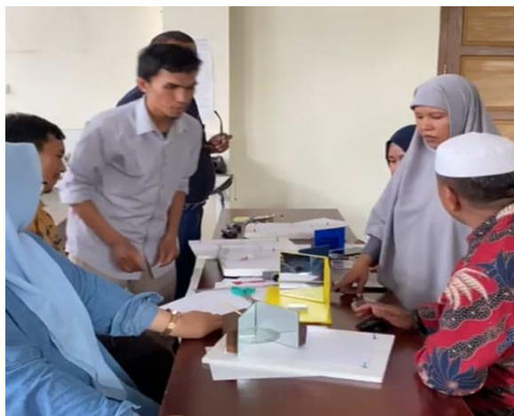
Gambar 2. Kegiatan persiapan pengabdian

Kegiatan persiapan dilakukan oleh tim pengabdian dengan ketua MGMP Fisika Kota Ternate pada tanggal 1 Mei 2024. Tim PkM diterima dengan tangan terbuka oleh ketua MGMP Fisika yang kesehariannya mengajar di SMA Negeri 4 Kota Ternate. Ketua MGMP sangat mengapresiasi kegiatan ini karena guru-guru Fisika SMA yang mengalami kendala dalam melaksanakan praktikum Fisika menjadi terbantu melalui kegiatan pengabdian ini. Pada kesempatan ini membahas juga terkait tempat, waktu, dan pelaksanaan kegiatan yang akan diselenggarakan. Setelah mendapatkan kesepakatan tentang apa yang akan dilakukan saat kegiatan PkM, tim pengabdian melanjutkan diskusi persiapan di laboratorium Fisika FKIP Universitas Khairun. Tim PkM dibagi menjadi dua kelompok kecil, yaitu tim persiapan alat peraga sederhana dan tim pengembangan LKS yang beranggotakan empat orang untuk masing-masing tim. Tim persiapan alat peraga sederhana mempersiapkan alat peraga praktikum cermin dan pemantulan berupa, styrofoam, cermin, pin, benang, busur. Tim pengembangan LKS mengembangkan LKS guided inquiry pada percobaan cermin dan pemantulan. Kegiatan persiapan pengabdian terlihat pada Gambar 2.