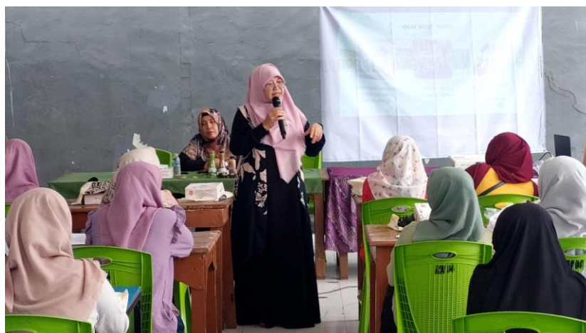
Gambar 3. Pemaparan Materi Analisis Pengembangan Usaha dan Motivasi Kewirausahaan

usaha berlangsung interaktif dan komunikatif dikarenakan diberikan kesempatan dan diskusi di tengah pemaparan materi.