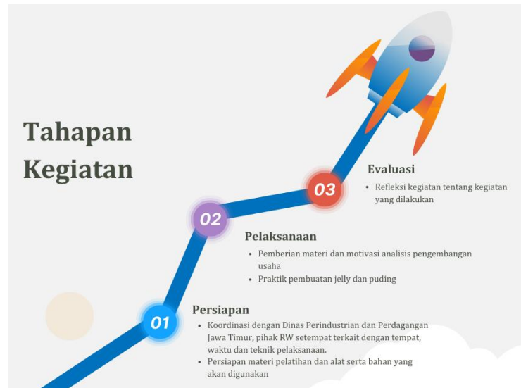
Gambar 1. Tahapan Kegiatan