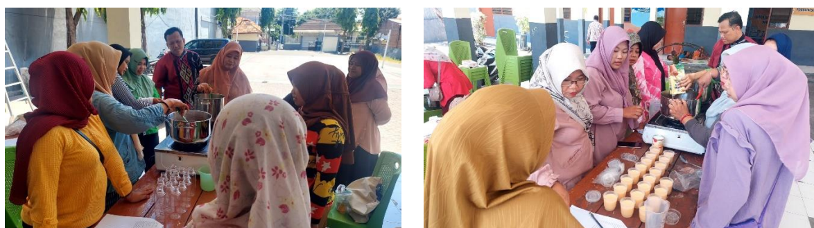
Gambar 4. Pendampingan pembuatan jelly dan puding oleh tim pelatih

Ada beberapa komponen yang harus diperhatikan agar peserta yang seluruhnya perempuan memiliki semangat entrepreneurship, seperti pelatihan entrepreneurship dan inovasi (Khamimah, 2021). Pemaparan materi terkadang menggunakan bahasa Jawa agar tercipta chemistry dengan peserta. Selanjutnya, materi utama, demonstrasi pembuatan jelly dan puding secara langsung, dengan bahan dan peralatan yang sudah disediakan di masing-masing meja kelompok. Untuk meningkatkan kerja sama dan kekompakan selama praktik, total 40 peserta dibagi menjadi empat kelompok dengan masing-masing 10 peserta. Saat demonstrasi didampingi oleh asisten instruktur dari tim de'Nil Puding sehingga peserta dapat dengan jelas mengikuti setiap arahan yang diberikan oleh instruktur karena tahapannya harus sesuai dengan prosedur agar menghasilkan jelly dan puding yang sempurna dan tahan lama. Peranan pendamping baik dari akademisi, lembaga pemerintah, dan praktisi dalam meningkatkan kemandirian masyarakat dalam berwirausaha tidak hanya sebagai supervisor, namun juga sebagai fasilitator dan motivator (Sugiana et al., n.d.).