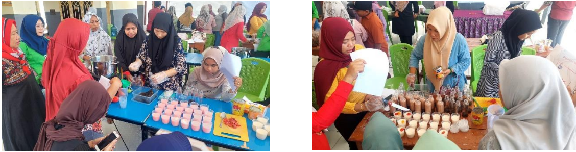
Gambar 5. Hasil akhir produk

mengajukan banyak pertanyaan. Karena latar belakang peserta yang sebagian besar adalah ibu rumah tangga, kegiatan pelatihan berlangsung dengan cepat dan lancar karena peserta sudah terbiasa menggunakan peralatan dapur dan memahami bahan.