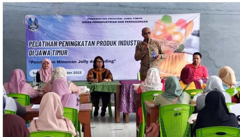
Gambar 2. Sambutan dari Dinas Perindustrian dan Perdagangan Jawa Timur

Pelaksanaan kegiatan pengabdian masyarakat ini dibuka oleh sambutan dari perwakilan Dinas Perindustrian dan Perdagangan dilanjutkan dengan sambutan dari Ketua RW 04 Telogo Sari Kelurahan Sambikerep Kota Surabaya. Kegiatan selanjutnya adalah penyampaian materi analisis pengembangan bisnis dan motivasi memulai usaha. Materi penutup adalah praktik langsung pembuatan jelly dan puding yang disampaikan oleh tim instruktur de'Nil Puding Surabaya. Materi praktik diawali dengan pengenalan bahan-bahan dan peralatan yang dipakai.