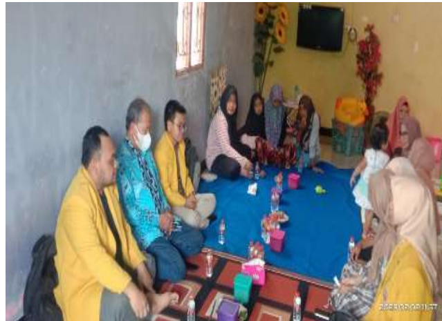
Gambar 2. Kegiatan Penyuluhan Asap Cair dari Tempurung Kelapa

serta dalam gerakan ini akan membantu mereka mengolah batok kelapa menjadi asap cair untuk memusnahkan serangga.