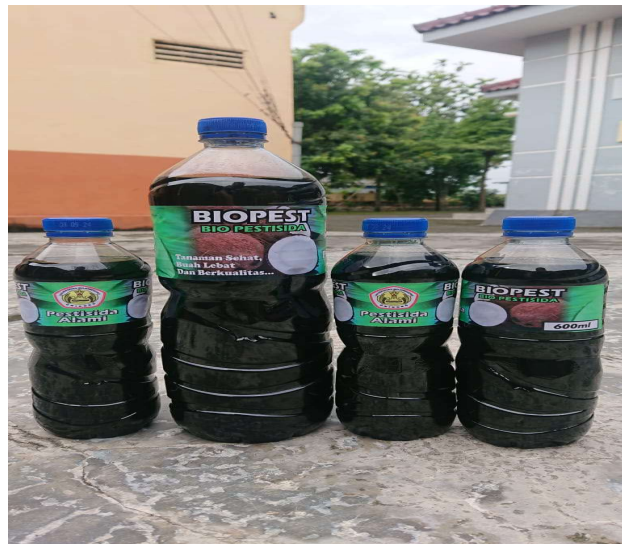
Gambar 3. Produk Asap Cair

Dalam penyuluhan ini dilaksanakan tahap-tahap yaitu: a) Sebelumnya dimasukkan ke dalam pembakaran, batok kelapa dibersihkan terlebih dulu dari tanah serta sisa sabutnya. Selanjutnya tempurung kelapa dipecah menjadi beberapa potongan sehingga daerah permukaan penyalaan menjadi lebih luas maka interaksi bisa berjalan lebih cepat. b) Selain itu, pengeringan dilaksanakan melalui cara dijemur di bawah sinar matahari, guna memangkas kadar air pada tempurung kelapa. c) Selanjutnya melalui cara konsumsi batok kelapa yang paling umum untuk menghasilkan asap konsumsi kering dengan massa masing-masing 7000 gram, 8000 gram, dan 15000 gram. d) Asap hasil pembakaran dikumpulkan dalam drum penimbun asap dilengkapi dengan tempat penampungan air berfungsi untuk pendingin. e) Cairan selanjutnya diambil dan dimasukkan ke dalamnya serta hasil pemurnian diwajibkan agar diperoleh asap cairan dari tahap pemurnian.